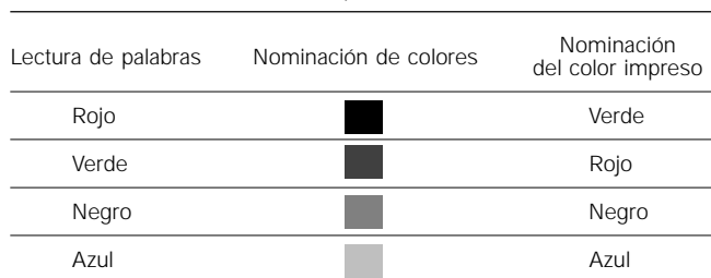
Tabla I. Test de interferencia Stroop Test .

B. El trastorno del criterio A interfiere significativamente en el rendimiento académico o en las actividades de la vida cotidiana que requieren capacidad para el cálculo.